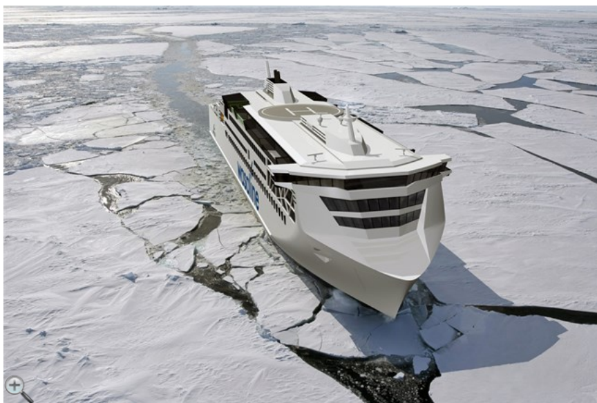
En ny färja är en del av Kvarkenprojektet Midway alignment.