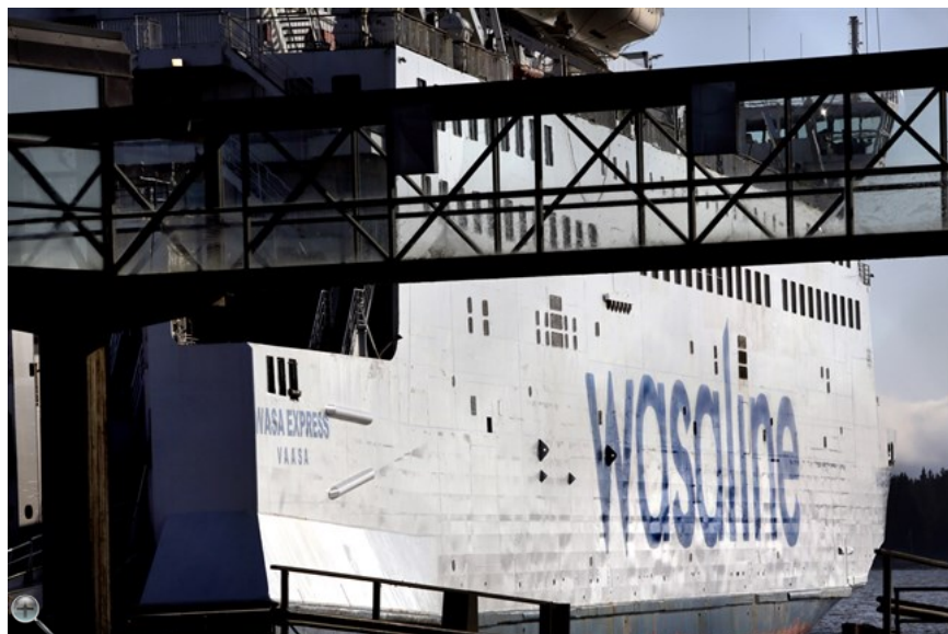
Motorerna på Wasa Express ska underhållas av Wärtsilä.