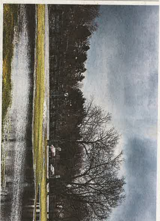
Tiklasparken ska täckdäckas.