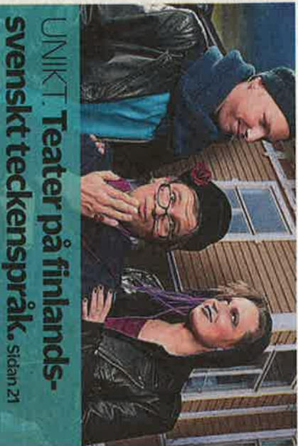
UNIKT. Teater på finlands-svenskt teckenspråk. Sidan 21