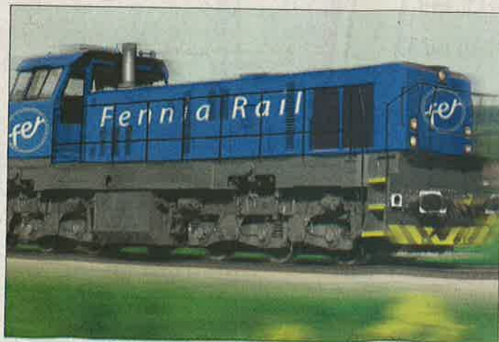
Fennia Rail on tilannut Tseikeistä kolme diesel-veturia, joilla se aikoo alkaa vetämään tavarankuljetuksia vielä tänä vuonna.

Rahkamon mukaan Fennia Rail aikoo haastaa VR:n nimenomaan muuntautumiskyvyllään.