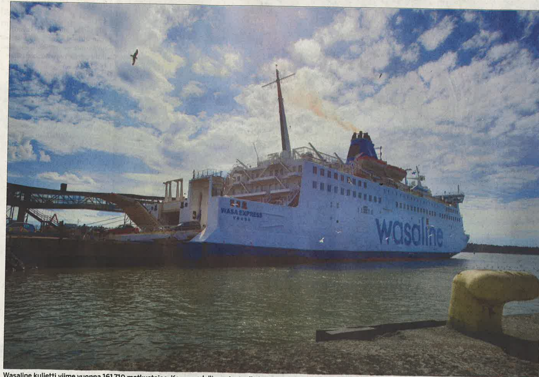
Wasaline kuljetti viime vuonna 161 710 matkustajaa. Kasvua edellisvuoteen oli yli viisi prosenttia.

-Koko laivan organisaatio on ollut hyvin motivoitunut ja tehnyt hyvää työtä, kommentoi Pe-