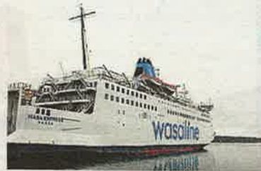
Wasaline behöver mera pengar.

med bidraget. Han skriver att rederiet måste ha pengarna på sitt konto senast i slutet av januari 2015. I Umeå är en ansökan på gång.