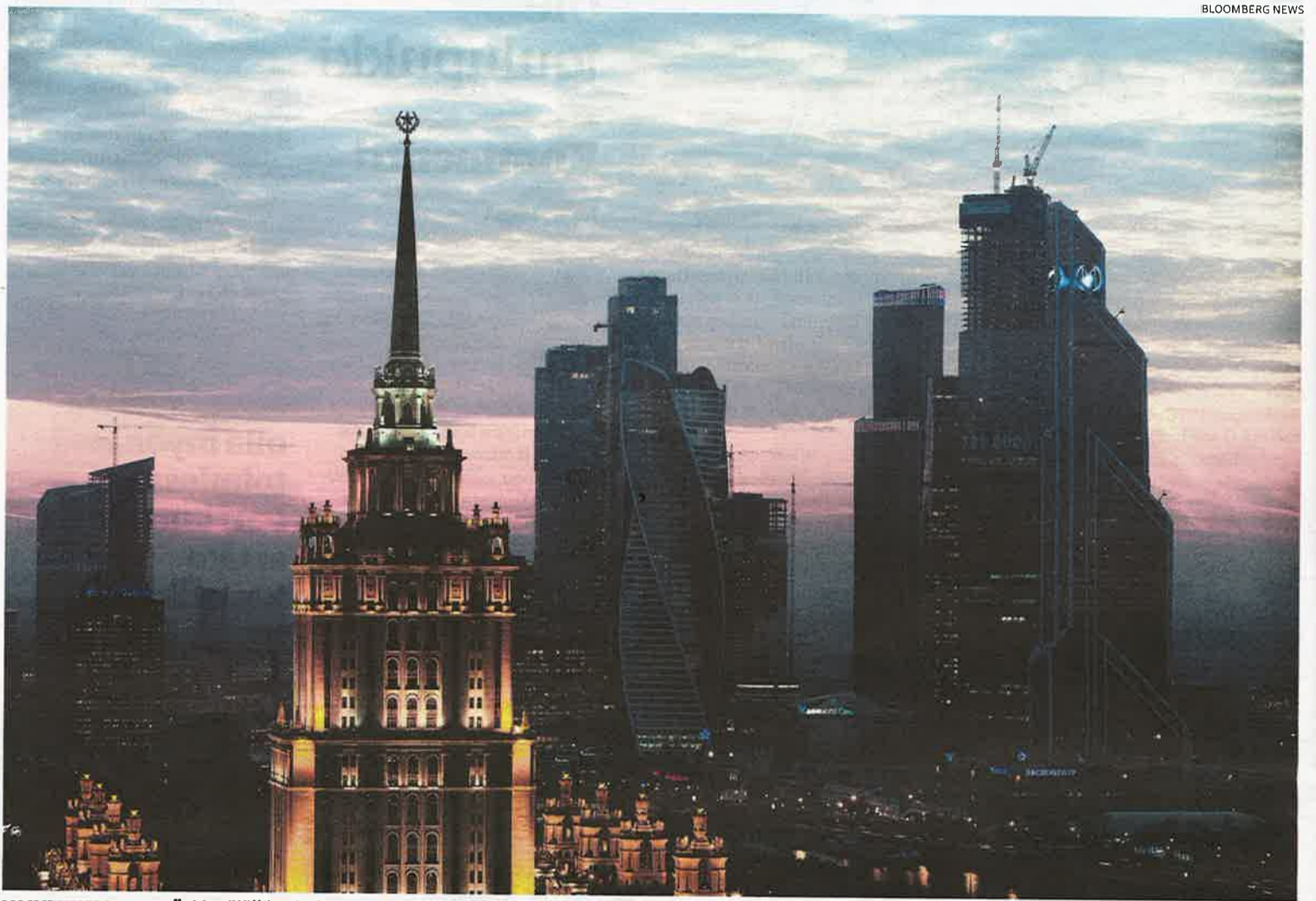
VAIKEUKSIA EDESSÄ. Venäjällä toimivan suomalaisbisneksen keväästä tulee vaikea. Kuva Moskovan bisneskeskuksesta, joka tunnetaan nimellä Moscow City.

Ensi keväästä onkin tulossa erit- täin vaikea varsinkin vähittäiskaup- pan alalle, sillä suuri osa esimerkiksi vaatteista, kengistä, elektroniikasta, lääkkeistä ja alkoholista on tuon- tivaravaa.