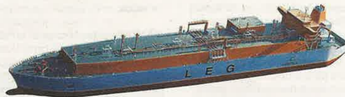
Så här kan ett lastfartyg för etan se ut. ILLUSTRATION: WÄRTSILÄ