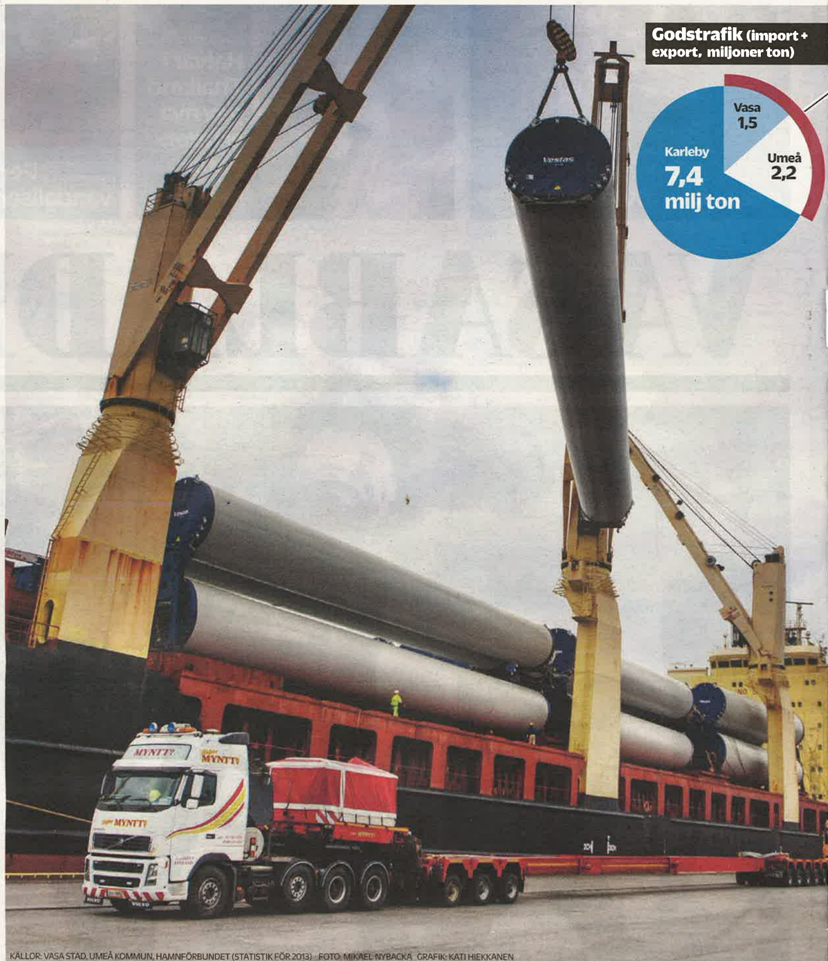
KALLOR: VASA STAD, UMEÅ KOMMUN, HAMNFÖRBUNDET (STATISTIK FÖR 2013). FOTO: MIKAEL NYBACKA. GRAFIK: KATI HIEKKANEN

Kvinnan skadade sig inte. Bilen fick skador på frampartiet medan kon som stötte samman med bilen synbarligen klarade sig utan större skador eftersom bägge två tog sin tillflykt ut på närliggande åkrar. Ägaren till korna lovade att rymlingarna snarast skulle fångas in och återbördas till sina kompisar, några erfarenheter rikare. vbl