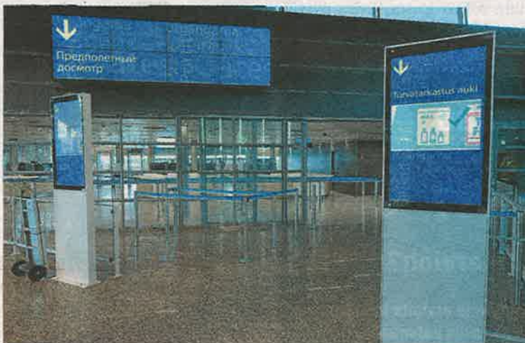
Lentoaseman ruuhkia helpottaa terminaali 2:n yläkertaan avattu uusi turvatarkastus, jossa on viisi linjaa.