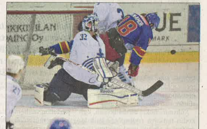
Nordic Betin mainokset näkyvät Jokereiden pelipaidoissa vain Suomen ulkopuolella pelattavissa otteluissa.

Ruotsalaiset lähtevät myös Etelä-Pohjanmaalle. PowerParkin johtajan Mikko Kiviluoman mukaan huvialueella on näkynyt paljon ruotsalaisten autoja. Sivu 4