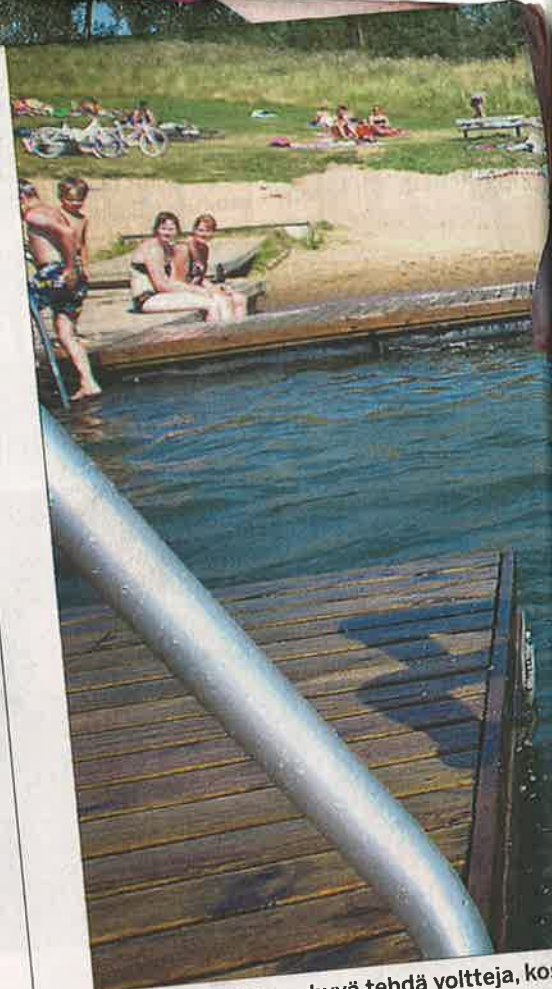
Tanelinrannassa on hyvä tehdä voltteja, kos

- EU-rahoitusta on helpompi saada, jos mukana on jotain uutta ja innovatiivista. Sivu 6