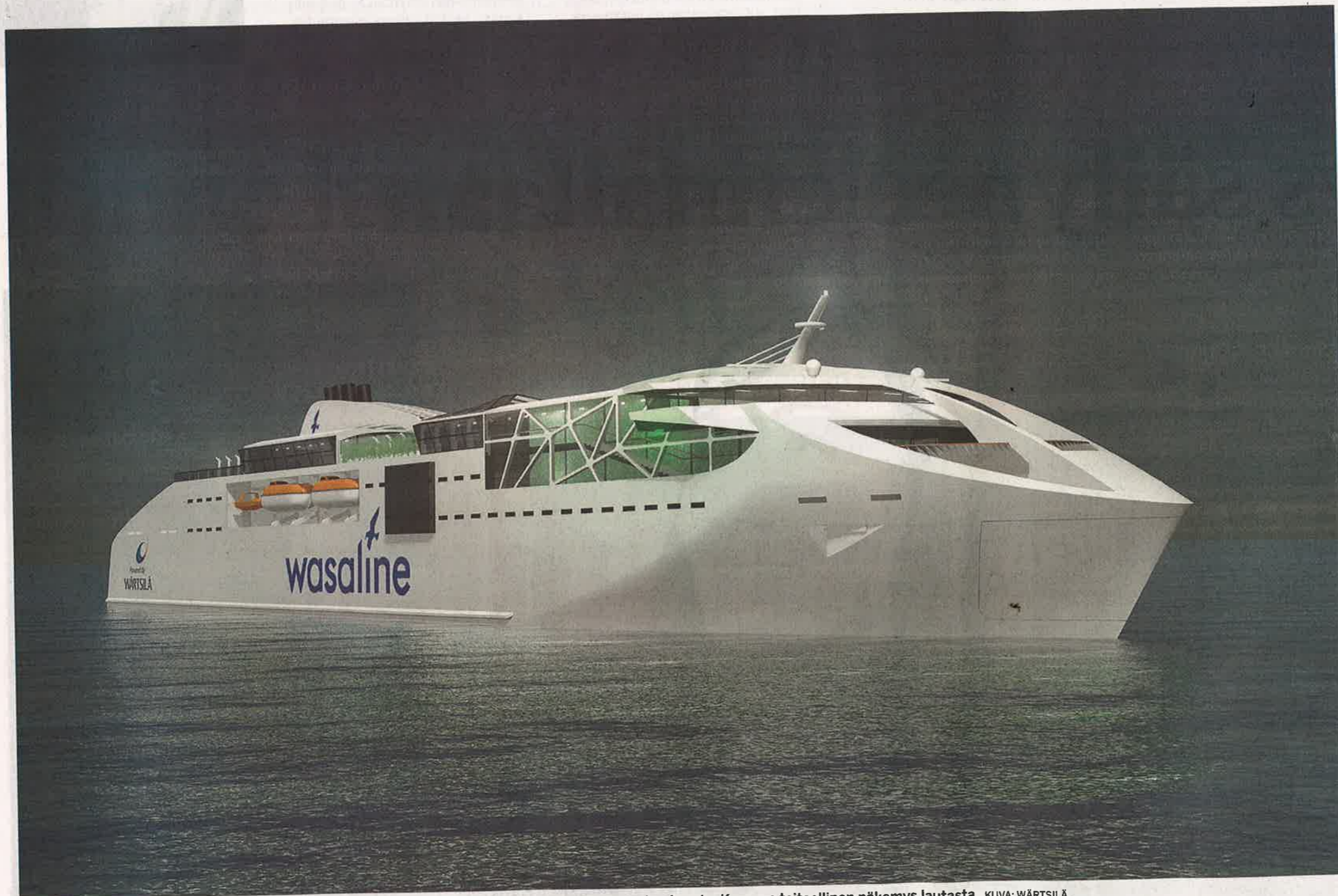
Wärtsilä voitti tarjouskilpailun ympäristöystävällisen Pohjanlahden lautan laivasuunnittelusopimuksesta. Kuvassa taiteellinen näkemys lautasta.