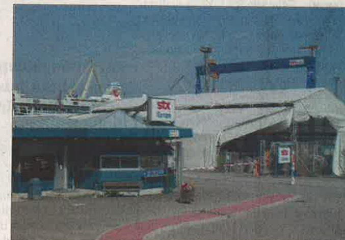
Suomen valtio ja Meyer Werft ovat Turun telakan uudet omistajat.