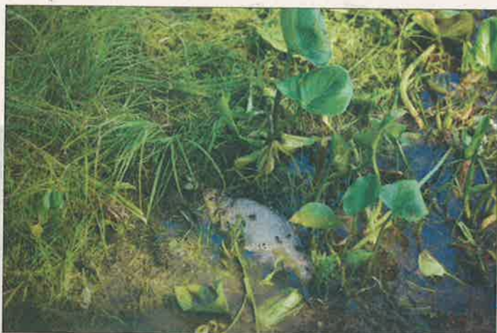
Pilvilammen kuolleet kalat on nostettu pois vedestä.