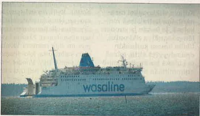
Helikopterin apua tarvittiin Wasalinen risteilyllä sairaustapauksen vuoksi.

Pilvilampea aiotaan jatkossa seurata tarkemmin sen varalta, että kuolleita kaloja ilmestyy lisää. Pilvilammen vesilaitoksen henkilökunta nosti kuolleet kalat pois vedestä.